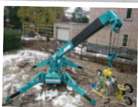
Pose de vitrages