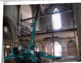
Constructions en acier