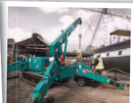
Travaux de levage variés