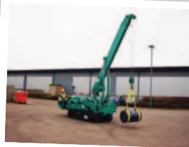
Déplacement de charge