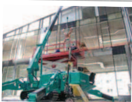
Pose de vitrages