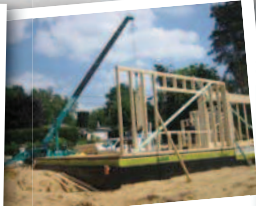
Charpentes en bois